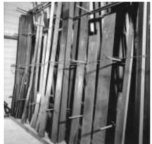
Bild 2: Vertikal gelagerter Formstahl in Gestellen, die gegen Rutschen und Umstürzen gesichert sind.