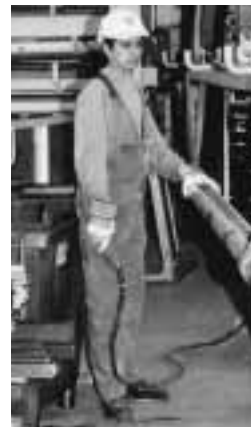
Bild 7: Die persönliche Schutzausrüstung (Handschuhe, Schutzschuhe, Schutzhelm) und der Einsatz geeigneter Hilfsmittel reduzieren das Unfallrisiko.