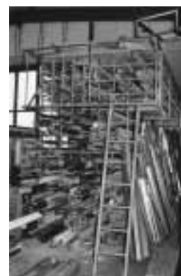
Bild 4: Horizontal gelagerte Profile auf einem hohen Gestell mit Zugangsplattform.