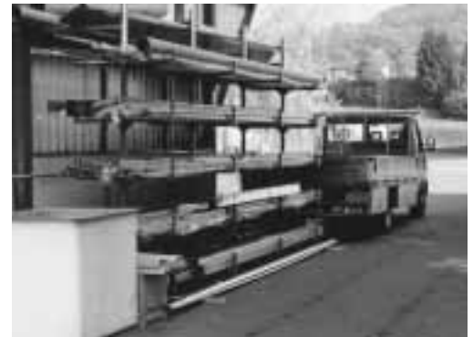
Bild 1: Warenannahme mit Gestellen, in denen die Profile provisorisch gelagert werden können.